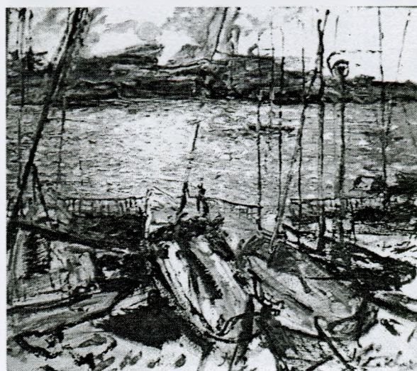
Николай Плехов. «Яхт-клуб «Омега» (2012)