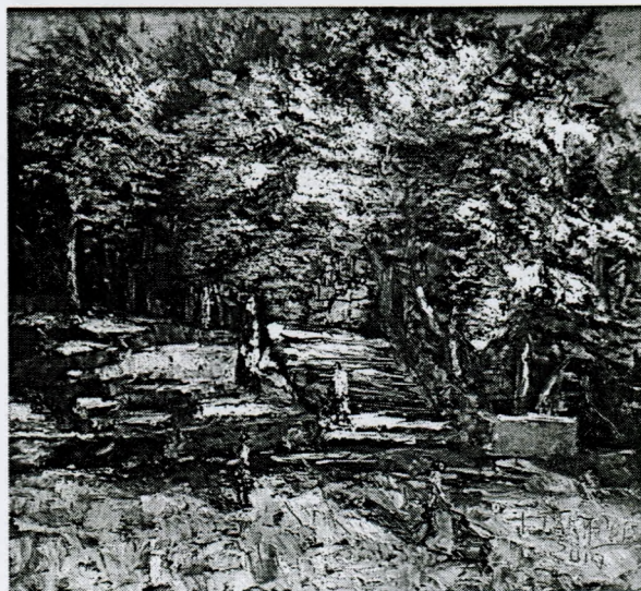
Тимур Такиров. «Улиця Каменця» (2014)