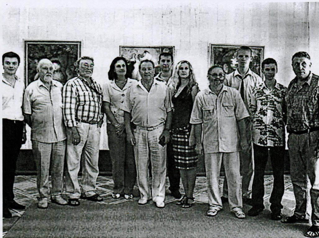
Выставка «Айванабугу» в выставочном зале Союза художников. Николаев. 2012