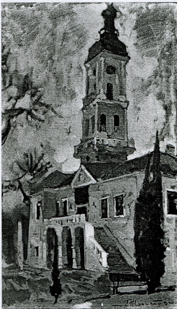
Тарас Шмаленко. «Русская брама» (2015)