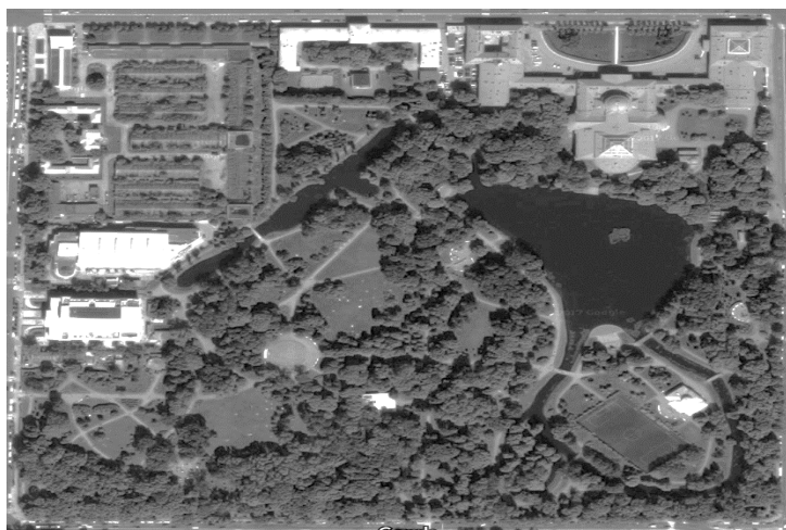
Рис. 2. Супутниковий знімок Таврійського парку в Санкт-Петербурзі.

живописний пейзаж відкривався з вікон палацу, а з іншого – щоб з деяких віддалених куточків парку було видно палац у всій красі або інші будівлі, що живописно відбиваються на поверхні водойми, створюючи локальні композиційні вузли. Самі водойми обов'язково присутні у парку. Їх площа залежала від площі парку та доступності водного ресурсу. В Санкт-Петербурзі вона