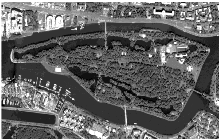
Рис. 3. Супутниковий знімок парку на Слагіному острові.

У Санкт-Петербурзі невеличкі пагорби мають штучну природу. В Богоявленську пологі схили Вітовської балки – справжня знахідка для ландшафтного майстра. Перепад висот у Богоявленському парку становить близько 20 метрів. Найвища точка – північна частина парку. Найнижча – водойми. Висота південного пагорбу – близько 10 метрів, але схили його крутіші за північні. Завдяки пагорбам зі схилами, що спускаються з боків до центральної водойми автор досягає ефекту, коли перспектива парку поступово переходить у живописний пейзаж лиману, що відкривається тільки в певних місцях парку (так званий прийом “ах-ах”).