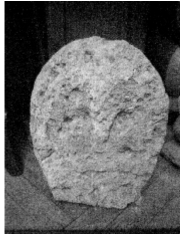
Рис. 1. Фрагмент нової антропоморфної плоскої скульптури скіфського періоду V ст. н.е. із с. Парутине (Миколаївська обл.)

Пласка скульптура V ст. до н.е. має досить чітку канонічну форму. При моделюванні рельєфної скульптури використовувався монолітний прямокутний блок, якому для створення художнього образу надавалась антропоморфна форма. Стилiзація антропоморфної пластики плоскої скульптури досягається завдяки не тільки формі, а й за допомогою декору. На її поверхні контуром вирізьблено елементи одягу, атрибутику, військову зброю, зображено руки та риси обличчя. Руки виконано у різних положеннях [6]. Можна виділити 3 основних різновиди. Перший — це чіткий антропоморфний силует у формі трикутника, звуженого донизу. На рівні поясу виділено перехід від тулуба до ніг, а верхня частина завершується умовним зображенням голови. Атрибути позначено рельєфним різьбленням, що є характерною рисою скіфської монументальної скульптури цього періоду. Цей принцип виконання ми бачимо на статуях із с.Кожем'яки (Херсонська обл.); с.Станішине (Кіровоградська обл.); с.Братолобівки (Херсонська обл.); с.Лупареве-Лимани (Миколаївська обл.) поч. V ст. до н.е.; с.Христофоровки (Миколаївська обл.); с.Мар'янівки (Миколаївська обл.); с.Золота Балка №1 (Херсонська обл.); с.Мамай Гора (Запорізька обл.); м.Маріуполь (Донецька обл.); с.Слав'янки (Дніпропетровська обл.); с.Надії (Кримська обл.); с.Косовське (Кримська обл.), датованих початком V ст. до н.е.