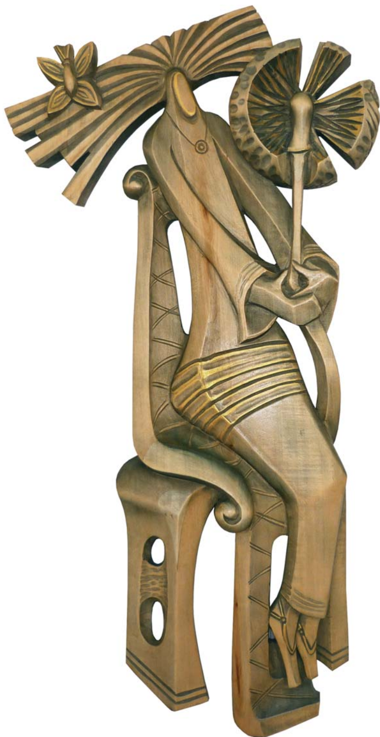
Девушка с одуванчиком