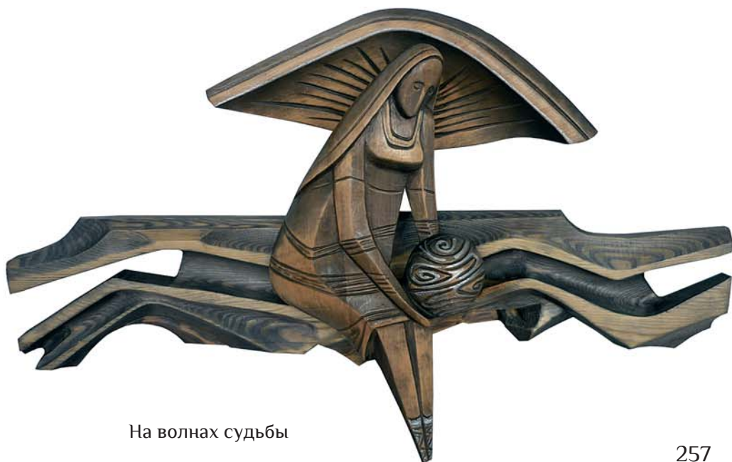
На волнах судьбы