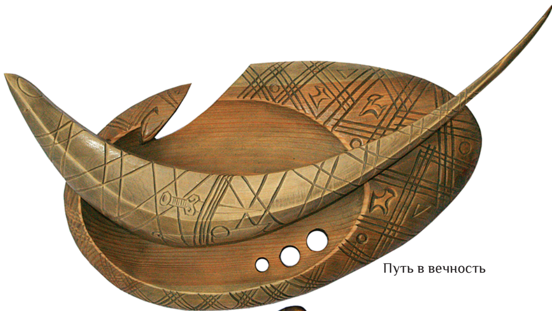
Путь в вечность