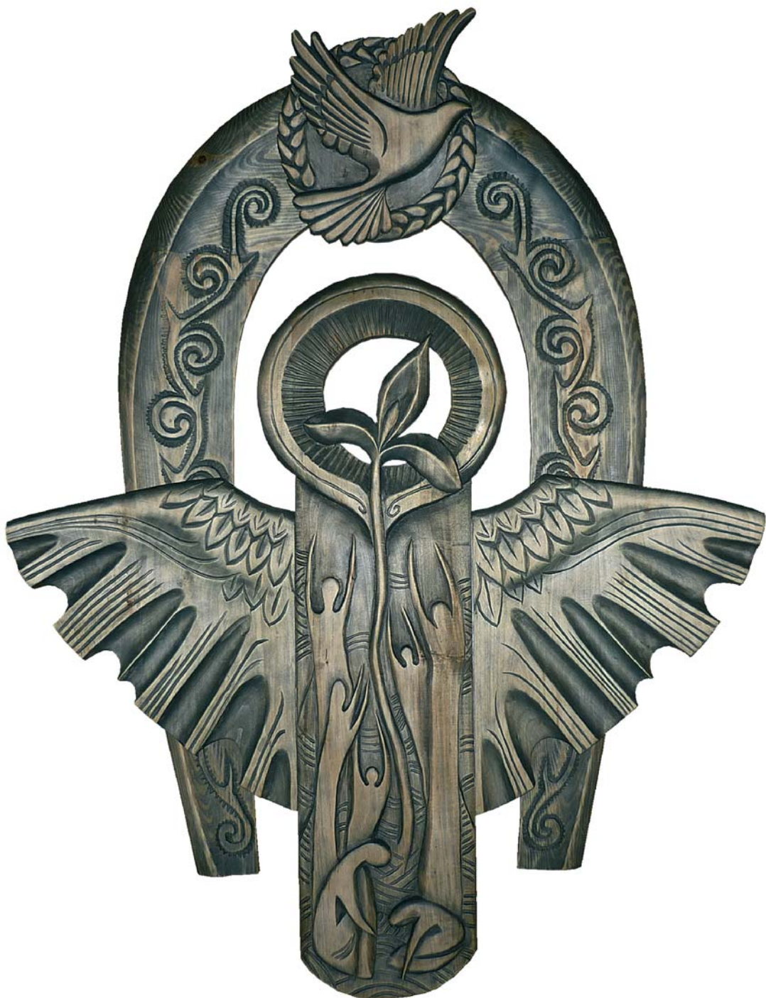
Надежда на жизнь