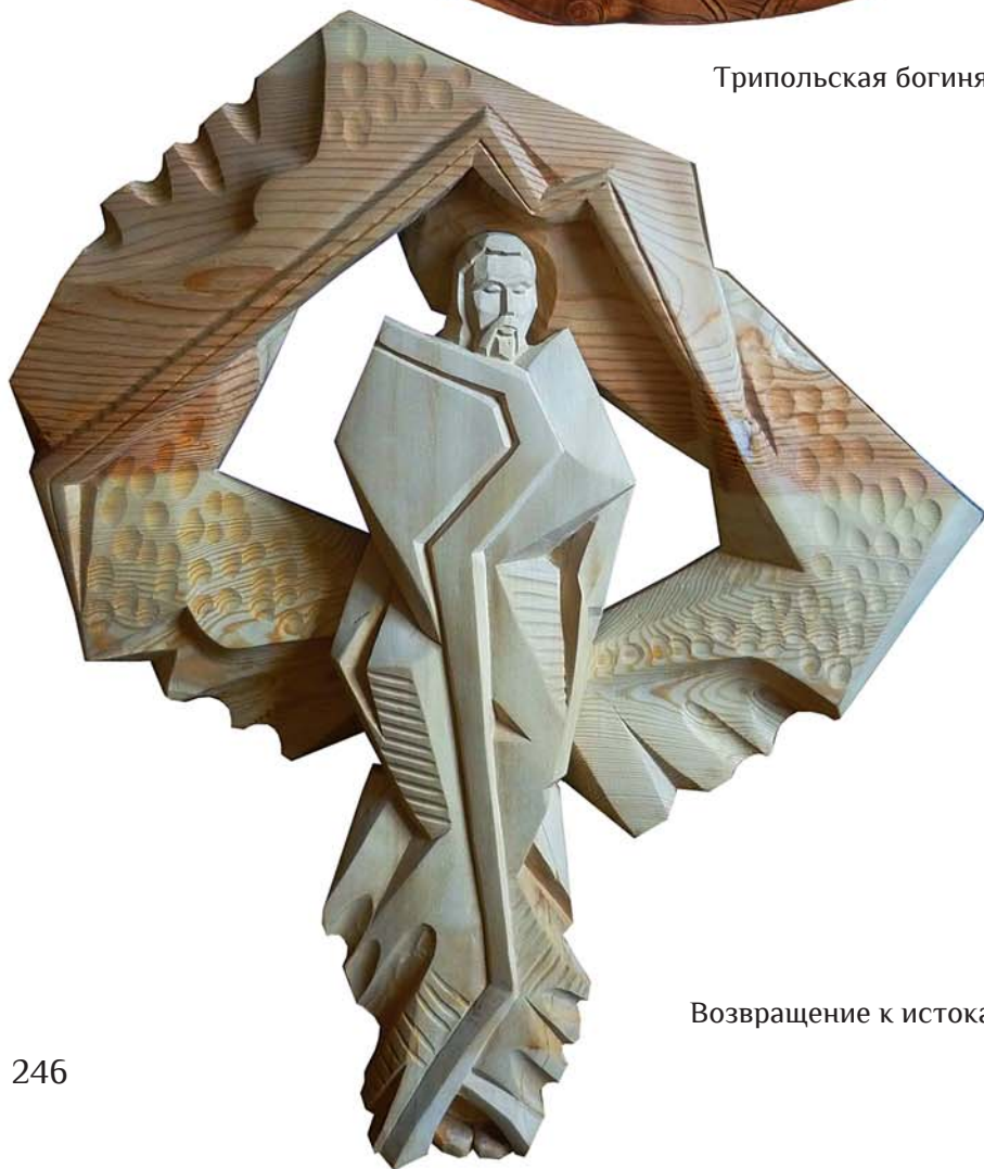
Возвращение к истокам