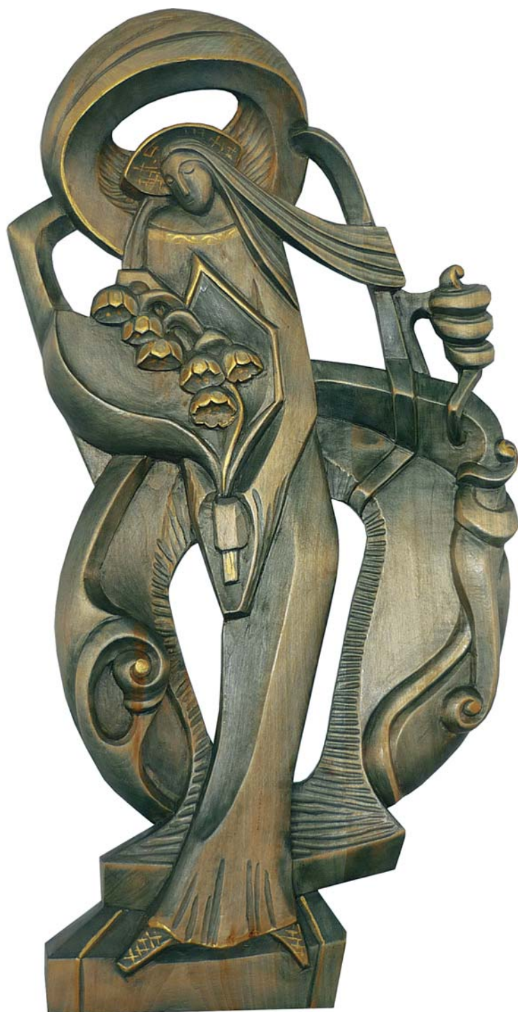
Девушка с ландышами (печаль и нежность)