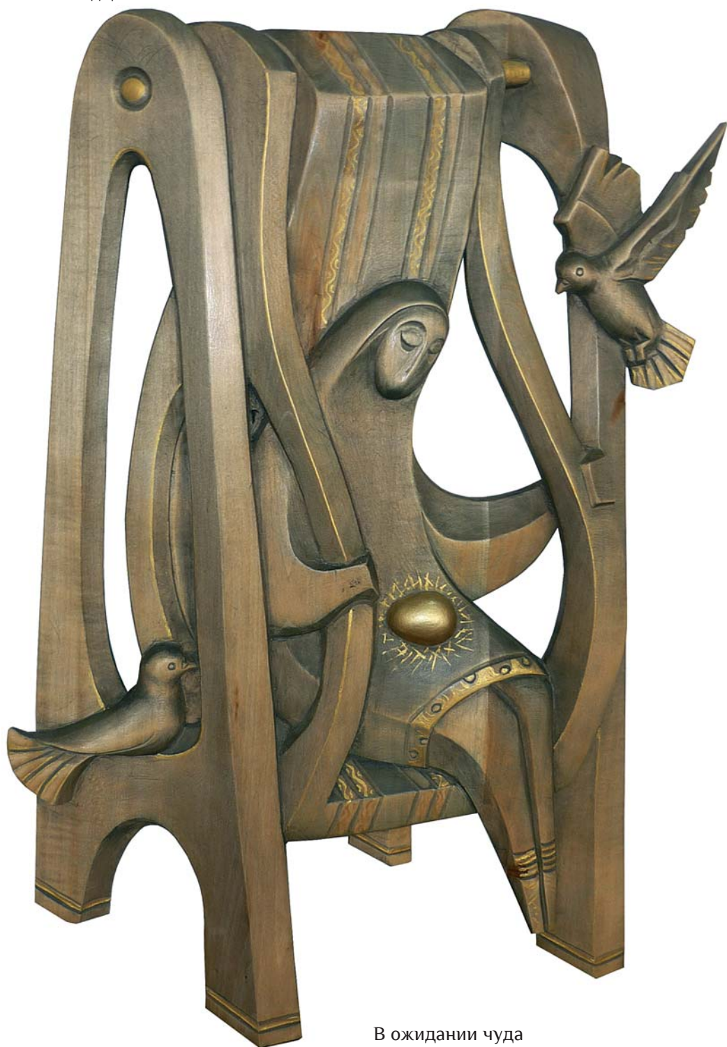
В ожидании чуда