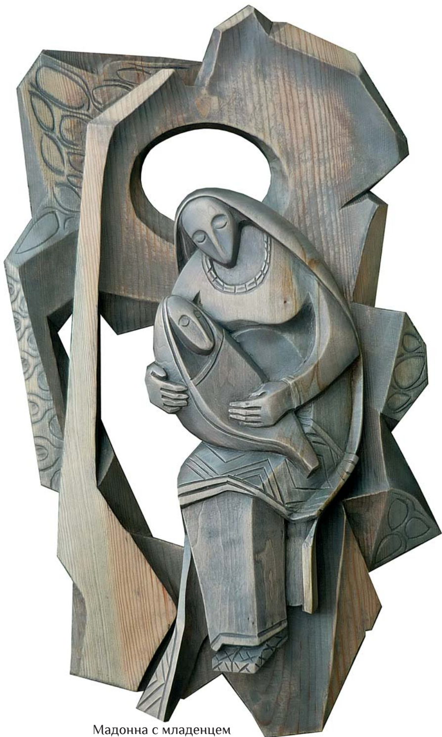
Мадонна с младенцем