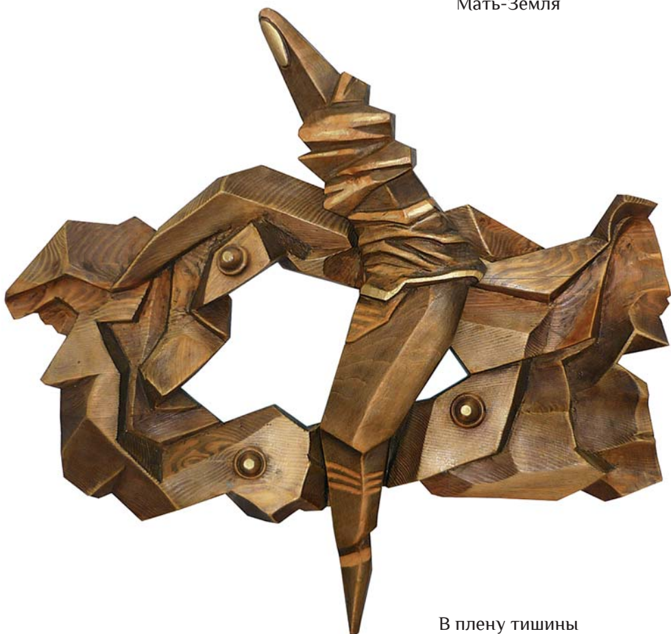
В плену тишины