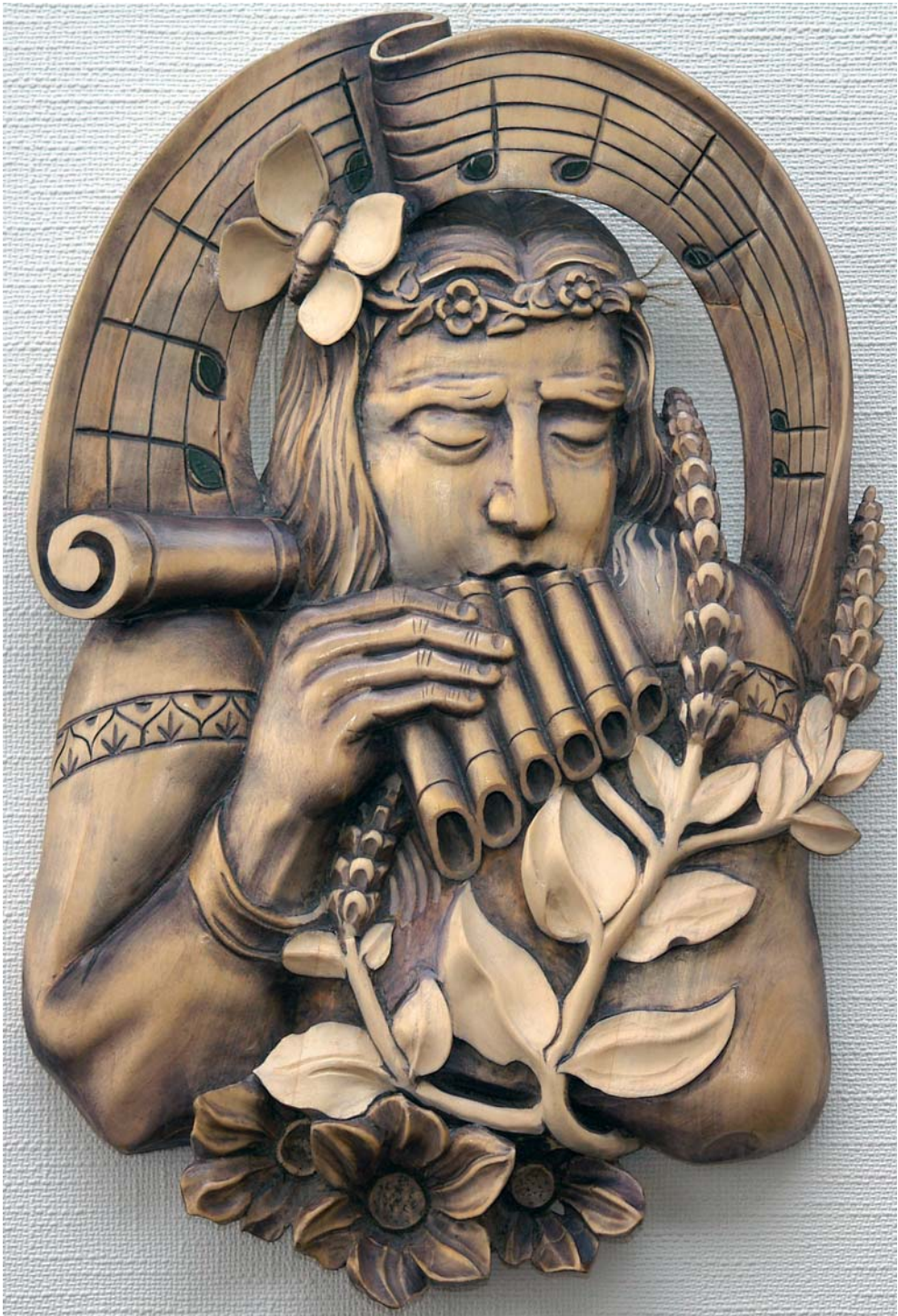
Василий и василёк