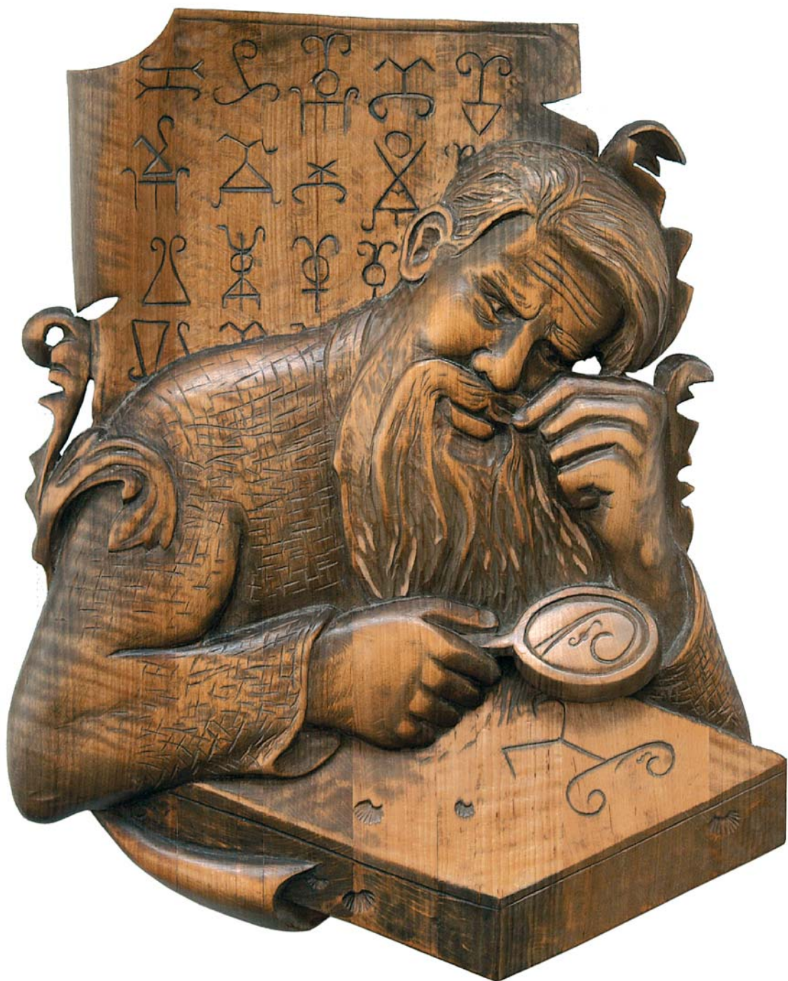
Каллиграфия сарматских тамг