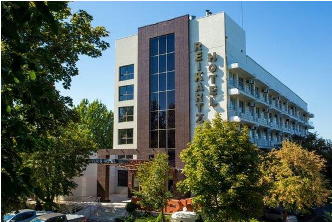
Рисунок 2.1 – готелю «Reikartz River» Миколаїв 3 зірки

Історія компанії Reikartz в Україні була започаткована у 2003 році у Львові, бельгійськими архітекторами на чолі з Франсуа Рейкарц (Francois Rysckaerts). Це був старт проекту створення української мережі готелів під брендом Reikartz Hotels & Resorts. Сьогодні національна мережа готелів Reikartz Hotel Group об'єднує 40 готелів в Україні та за її межами. Всі готелі об'єднані під брендом Reikartz Hotel Group.