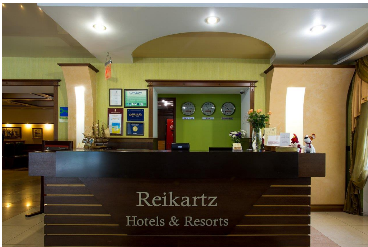
Рисунок 2.2 – вестибюль готелю «Reikartz River» Миколаїв 3 зірки

Архітектурне оздоблення головного входу в готель залежить від виду готельного комплексу та від гостей, для яких він передбачений. Оскільки готель відвідують 60-70% іноземців, то його оформлення у сучасному стилі дає йому перевагу серед інших готелів зі звичайним інтер'єром. Таке оформлення чудово сполучається зі сучасними вимогами комфорту.