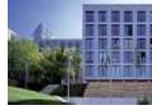
Studenten - wohnheim