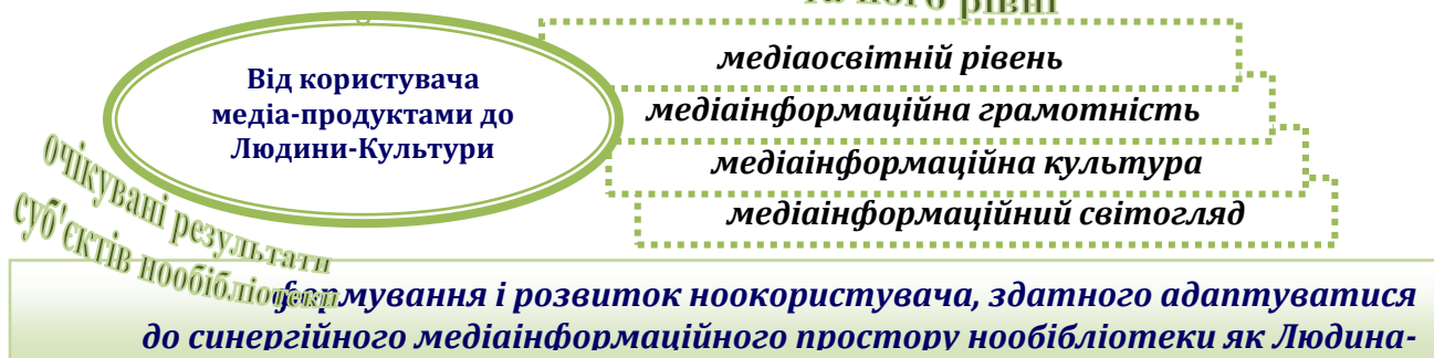
Рис. 1. Модель науково-педагогічної нообібліотеки