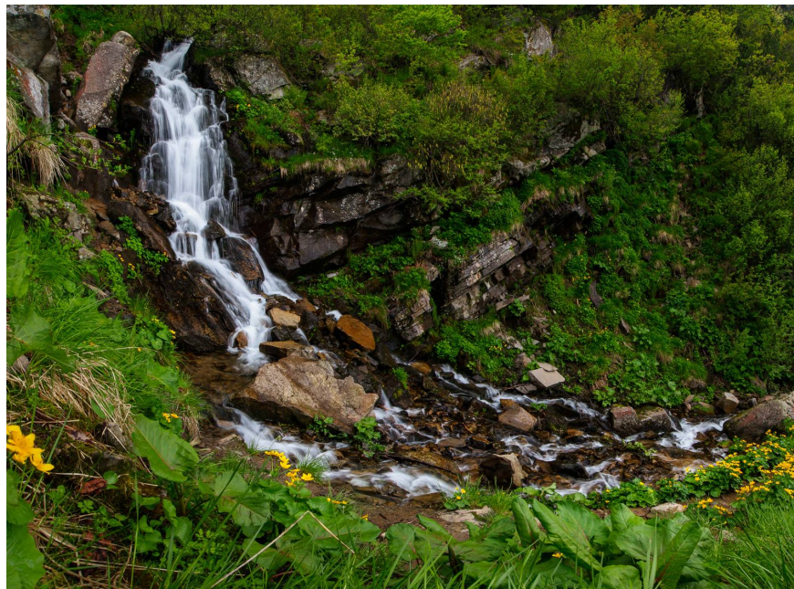
Рисунок 1 Каскад водоспадів в Українських Карпатах (масив Чорногора)

На Дзембронські водоспади. Дзембронські водоспади, що знаходяться в Берестечку представляють собою каскад з 15-20 водоспадів, які знаходяться на потоці Мунчель. Весь потік створює каскад водоспадів, недалеко від села Дземброня, поряд з Берестечком, на схилах г. Смотрич.