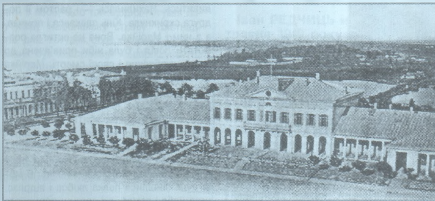
Перший будинок художнього музею ім. В. В. Верещагіна.

Після революційних подій 1917 року Гедройц не покинув батьківщини. Відомо, що з 1918 року він живе у Харкові, працює інструктором музейної секції Харківського губернського Комітету охорони пам'яток мистецтва і старовини, з 1921 року — експертом Харківського художньо-історичного музею, а з 1926 — реставратором художнього фонду соціального музею ім. Артема.